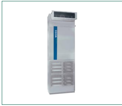
Ściennej moduł recykulacyjnyjny

Jeśli mówimy zatem o przepływie laminarnym, musimy również poruszyć problematykę związaną z badaniami, które pozwolą na weryfikację laminarności przepływu badanego stropu. Badanie takie (wg VDI) przeprowadza się prowadząc pomiary