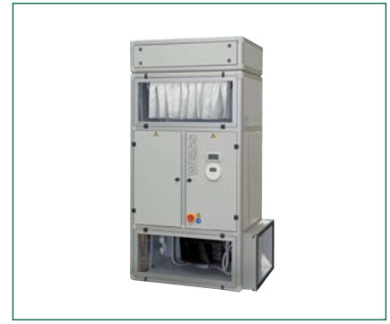
Jednomodułowa szafa klimatyzacyjjna

Dodatkową korzyścią stosowania modułów recykulacyjnych jest zmniejszenie przekrojów kanałów łączących urządzenie klimatyzacyjne ze stropem laminarnym, a co za tym idzie – ułatwienie ich przeprowadzenia (szczególnie istotne w tematach modernizacji bloku operacyjnego). Firma Weiss Klimatechnik wprowadziła na rynek dwa typy niniejszych modułów. Jeden z nich – Ściennej Moduł Recykulacyjnyjny – może być zastosowany zarówno wewnątrz, jak i zewnątrz sali operacyjnej. Stosowanie na zewnątrz daje korzyści obniżenia głośności pracy wentylatora w sali operacyjnej, jak i możliwość wymiany filtrów (znajdujących się w module) poza salą operacyjną. Drugi moduł (będący jednomodułową szafą klimatyzacyjną) jest wyposażony w niezależny układ chłodniczy oraz nawilżacz parowy. Ta jednomodułowa szafa klimatyzacyjna w wykonaniu higienicznym z powodzeniem sprawdza się w układzie kilku sal