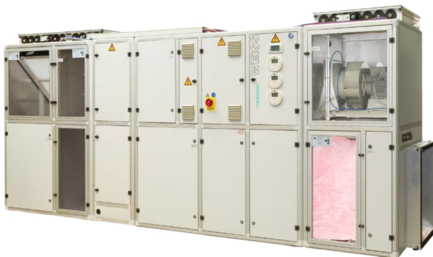
Kompaktowa szafa klimatyzacyjna Mediclean w wykonaniu higienicznym Weiss Klimatechnik

Pierwszą z nich jest funkcja filtracji poprzez zastosowanie odpowiedniej klasy filtrów (H13-H14). Przy czym decydują-